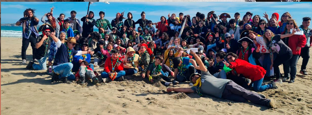
GRUPO SCOUT CHAMINADE EN SU CAMPAMENTO DE INVIERNO